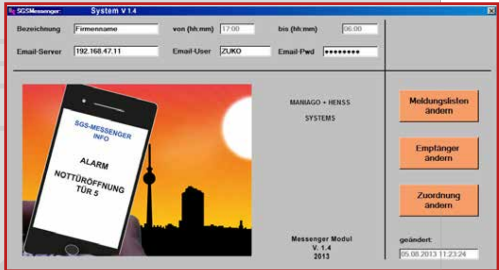
SGS Messenger Software Hauptfenster

Damit informiert das SGS Messenger-Modul rund um die Uhr über wichtige Alarme und Meldungen aus dem vernetzten Zutrittskontroll- oder Rettungswegmanagement-System.